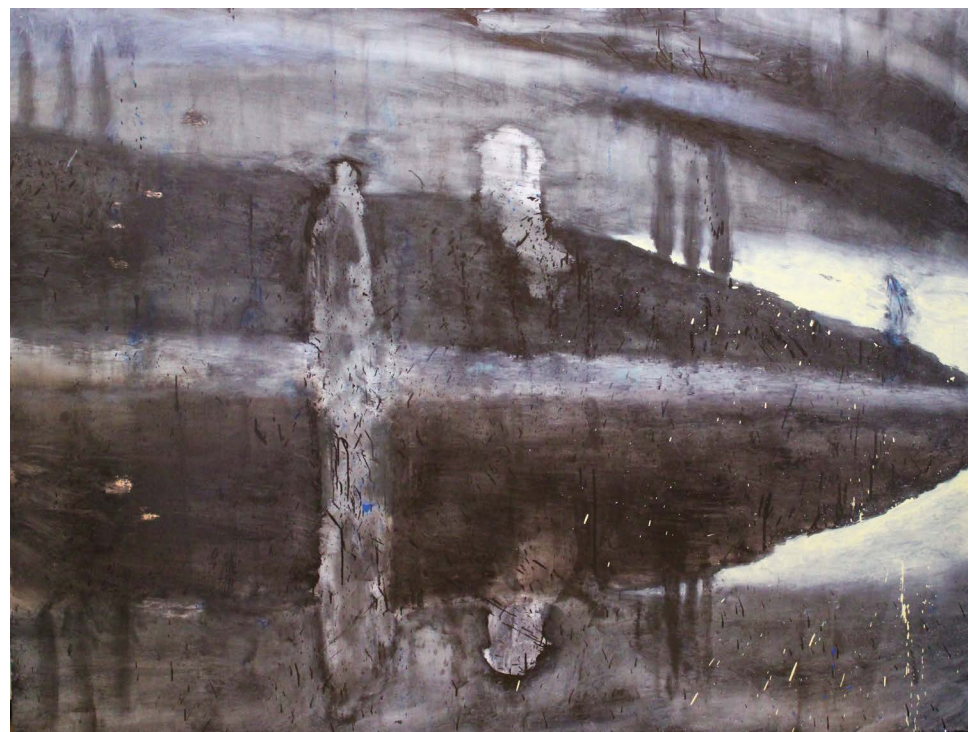
ŽALOST IMA ČLOVEŠKO SRCE, olje na platnu, 150x200 cm, 2017