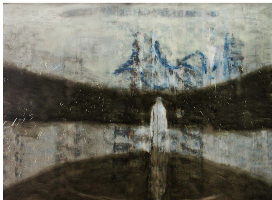
HOJA PO VODI, olje na platnu, 150x200 cm, 2017