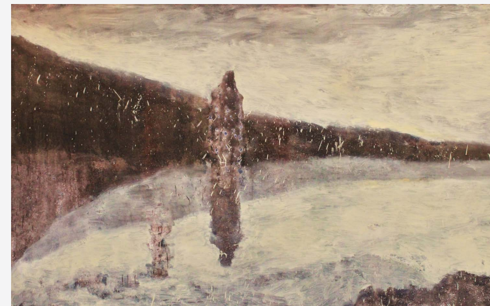
IME MI JE REKA, 150x240 cm, olje na platnu, 2017

MAKEDONSKO KULTURNO DRUŠTVO "Sv. Cirila in Metoda" iz Kranja