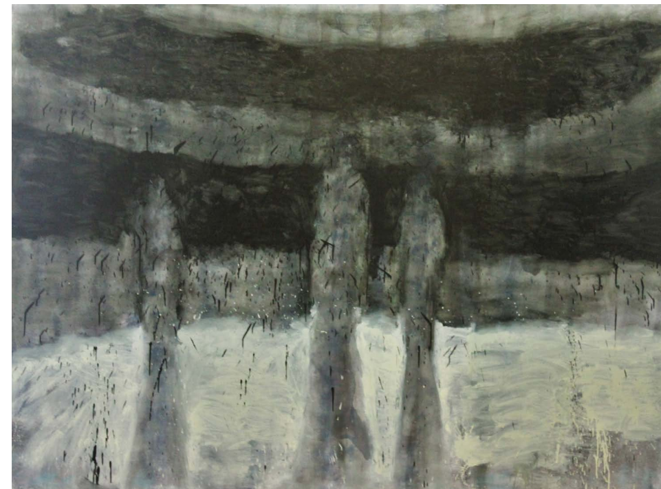
PRIHOD KRALJEV, olje na platnu, 150x200 cm, 2017